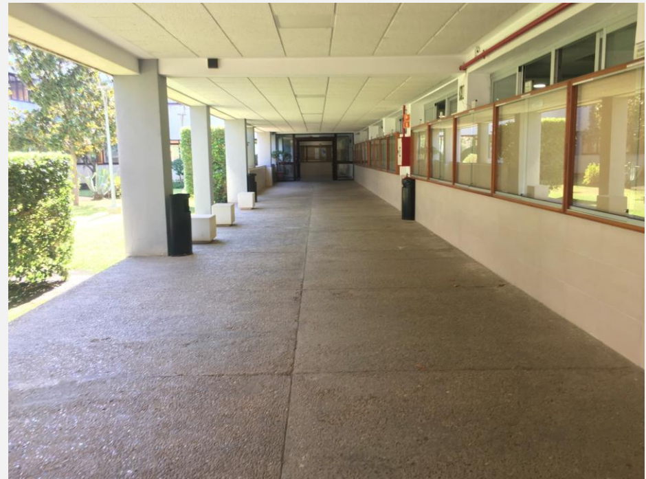
Eliminación de barreras COVID en el Centro

No son necesarios planes de contingencia en los Proyectos Docentes